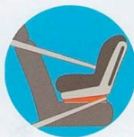
Лицом против движения